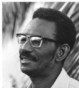
Cheikh Anta Diop